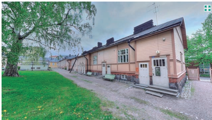
FIGURA 3. Cases del Työväenasuntomuseo (Museu de l'Habitatge Obrer), que forma part del Museu d'Hèlsinki. Els interiors han estat restituïts per a diferents moments del segle xx.

aplega un gran museu central d'història urbana junt amb el Museum der Arbeit (Museu del Treball), diversos espais museïtzats al port històric, el museu local d'Altona i algunes cases burgeses; ara té, en conjunt, nou seus. Un altre exemple, amb un model de relació entre espais museístics més articulat, és el del Muzeum Historyczne Miasta Krakowa (Museu d'Història de la Ciutat de Cracòvia), amb dinou seus, algunes d'incorporació molt recent. Cobreixen la història i el patrimoni des de la ciutat medieval fins al nostre temps, amb un pes notable dels espais dedicats a la Segona Guerra Mundial i la condició dels jueus, amb la sinagoga medieval de Kasimierz reconstruïda i la fàbrica d'Oskar Schindler. L'any 2010 el museu va obrir a les excavacions del subsol de la plaça del Mercat (Rynek Główny) un recorregut temàtic sobre el vincle històric entre Cracòvia i Europa, impulsat directament per l'Ajuntament amb fons europeus. Aquest és a hores d'ara l'espai més freqüentat del museu, per bé que la seva plasmació museogràfica, molt marcada pels efectes especials, ha estat motiu de polèmica. A Hèlsinki, per la seva part, el vincle de la seu principal amb el que el museu defineix com «les nostres altres seus» és la modernització de la ciutat, amb una casa burgesa de 1860, els habitatges obrers de principi del Nou-cents, el dipòsit de tramvies i les exposicions sobre la societat urbana a Villa Hakasalmi.