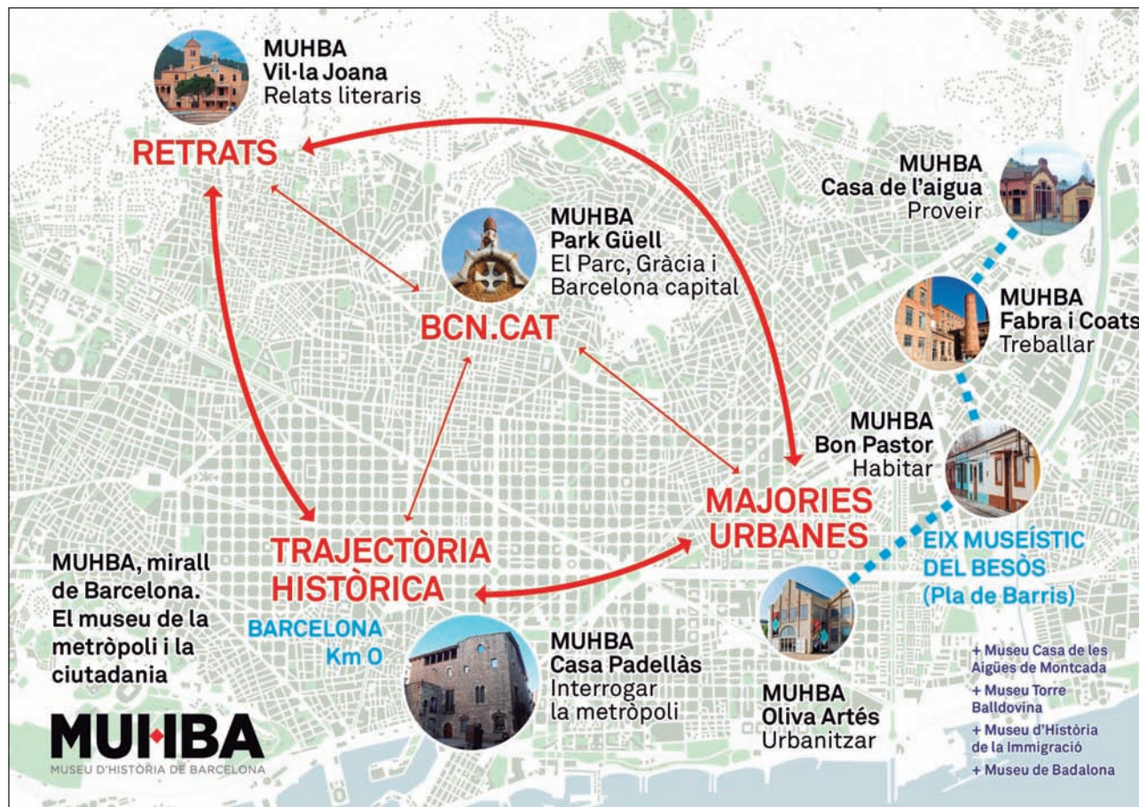
FIGURA 8. Esbossos per a la ideació estratègica —conceptual i urbana— del museu, 2018.

tuar-hi treballs diversos i convindria estudiar com crear un clúster d'empreses dedicades al ram del patrimoni cultural. La proposta es completa amb l'ampliació del centre, que per poder conservar màquines, vehicles, art públic retirat i altres objectes de grans dimensions necessitaria una nau que reunís condicions tant per a custodiar-los com per a fer-ne un espai atractiu per a les visites ciutadanes, en consonància amb la voluntat d'incorporar la Zona Franca a un ús ciutadà més intens: una «Col·lecció Franca de Barcelona» amb les peces grans de la ciutat contemporània. Ambdues operacions combina-