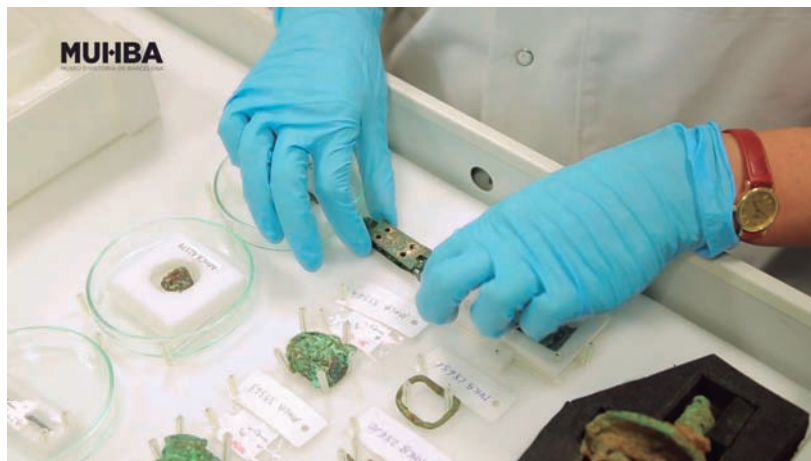
FIGURA 9. Sala dels metalls del MUHBA Centre de Col·leccions, al polígon de la Zona Franca.

Entre les polítiques culturals i les polítiques urbanes, el planejament urbà del segle XXI hauria de tenir molt presents els múltiples potencials dels museus de ciutat