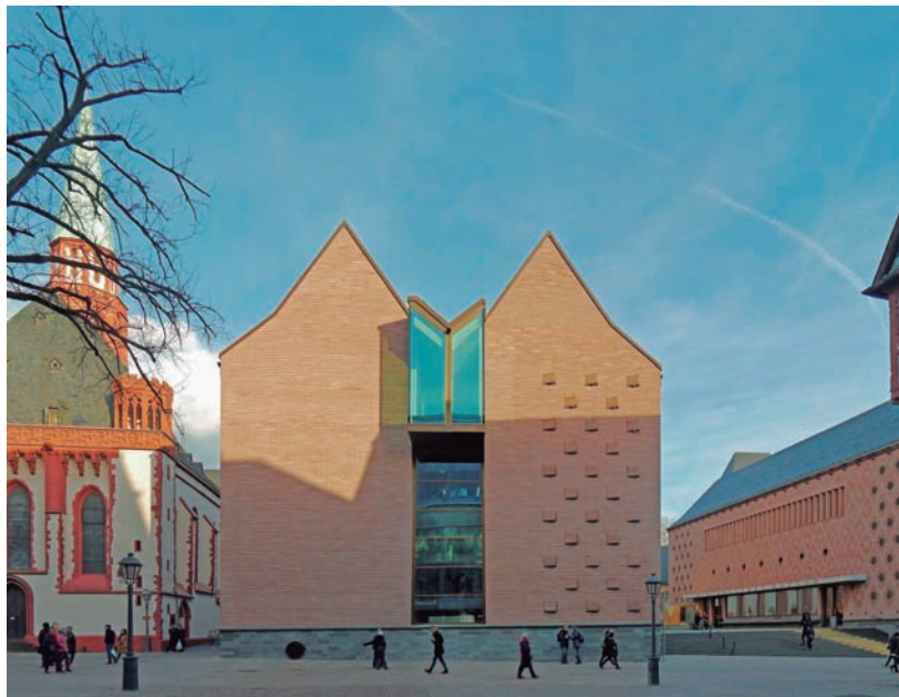
FIGURA 2. L'Historisches Museum de Frankfurt.

«assegura un aprenentatge al llarg de tota la vida mitjançant programes de formació i cocreació». 15