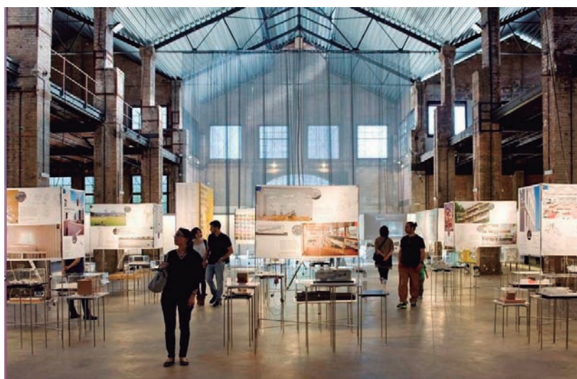
FIGURA 7. Interior del MUHBA Oliva Artés, la seu dedicada a la metròpoli contemporània en format de museu laboratori, situada vora l'encreuament de Diagonal i Pere IV.

L'any 2008 el museu va optar per les naus de l'antiga fàbrica Oliva Artés com a espai idoni per a mostrar la metròpoli contemporània, amb un estil de funcionament de museu laboratori. El Poblenou era el lloc adient pel seu paper en totes les grans transformacions urbanes a la plana de Barcelona, des de l'alba de la ciutat manufacturera al segle XVIII fins avui mateix, incloent-hi la zona 22@. L'elecció de l'espai concret fou molt estudiada: Oliva Artés, al Parc del Centre del Poblenou, és a la cruïlla de l'eix metropolità que és l'avin-