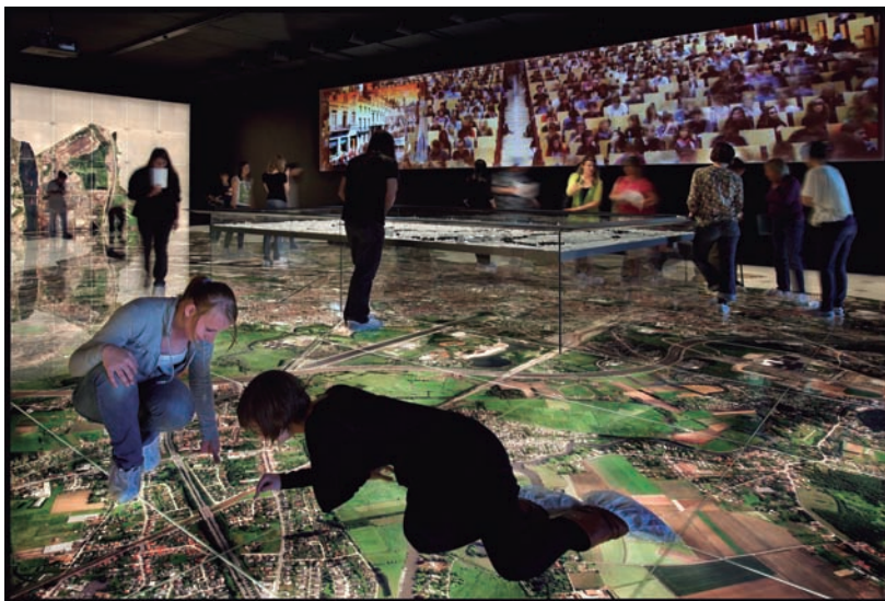
FIGURA 4. Entrada a l'STAM, amb la imatge interactiva de Gant.

tra les ciències socials a l'escala de la nació, i de tot plegat es desprèn un cert «analfabetisme urbà» que, paradoxalment, pot fins i tot créixer en l'era d'Internet si l'ús constant del geolocalitzador fa prestar menys atenció a l'entorn. No és una qüestió banal en un món urbà en què els efectes de la globalització, incloent-hi els grans desplaçaments migratoris i de refugiats, coincideixen en la vida quotidiana en tots els àmbits, i en què es poden propiciar tant el conflicte com, ben al contrari, l'entesa amb acords pràctics entre els uns i els altres en el frec a frec quotidià.