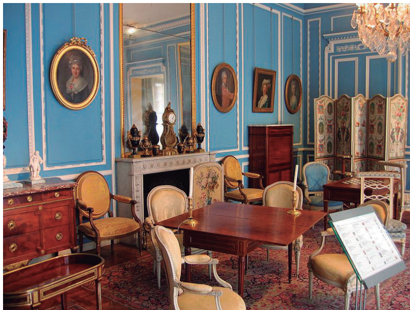
FIGURA 1. La sala 53 del Musée Carnavalet, abans de la reforma iniciada el 2016 del museu de la ciutat de París.

aviat fou general al continent: a Cracòvia, per exemple, també es parlava d'un museu de la ciutat des de la dècada de 1860, encara que la seva concreció va tenir lloc molt temps després.